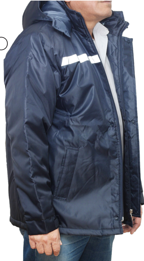
TABLA DE REFERENCIA POR TALLE

Minería / Petroquímicas/Construcción / Forestal / Agricultura / Laboratorios / Deportes / Vigilancia/ Transporte/ Logísticas/ Mantenimiento Mecánico/Industria en General.