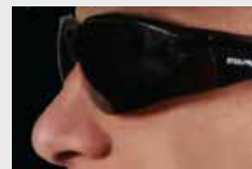
Lente de seguridad Steelpro

Todos los lentes Steelpro cumplen con la certificación ANSI Z87.1. Por lo tanto han pasado por las pruebas de: